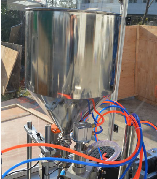
Tolva: Sistema de Llenado de la Bomba de Pistón: