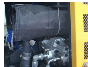
Filter & Silencer