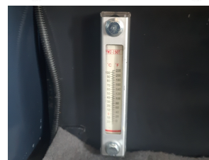
Hydraulic oil tank