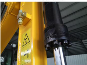
High pressure Cylinder