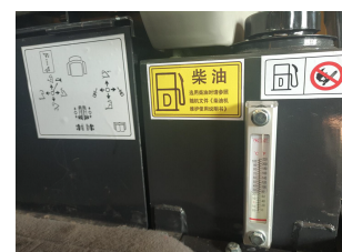
Diesel oil tank